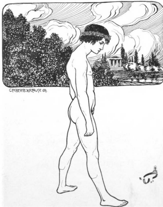
Abb. 1: Frontispiz-Zeichnung von Paul Casberg-Kraus.

Aus: Benedict Friedländer, Renaissance des Eros Uranios , Berlin 1904.