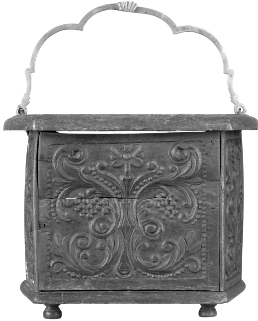
Abb. 1: Fußwärmer, 1808, 10,5 cm (H), 12 cm (D), Holz (Kasten)/ Messing (Henkel)/Ton (Gluttopf). LWL-Freilichtmuseum Detmold, Inv. Nr. 1977:800.

Wärmespender als auch als Schaustücke zum sonntäglichen Kirchgang mitgenommen wurden. Ein Beispiel dieses Gebrauchs zeigt Emmanuel de Wittes Gemälde Innenansicht der Amsterdamer Oude Kerk (Südseite) 3 von 1661.