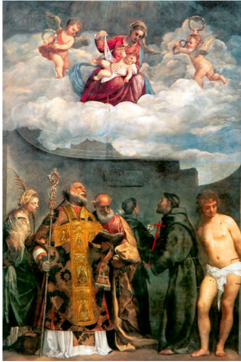
Abb. aus Filippo Pedrocco, Tizian, München 2000, Abb. 64, S. 131.

Diese geschlechtliche Zuschreibung lässt sich weiter auf der Ebene der Akteurinnen und Akteure verfolgen. Dolce unterschied deutlich zwischen der Malkunst Tizians und der Schminckkunst der Frauen. Mit »schönem Können« ( tanta bella maniera ) würden sich viele Frauen »weiß« ( bianco ) und »rot« ( vermiglio ) »färben« ( tingere ) um die Männer mit dieser »Erscheinung der Farben« ( apparenza de' colori ) zu »täuschen« ( ingannare ). 48 Dieser stereotype Betrugsvorwurf beinhaltet in der philosophisch-theologischen Tradition der Kirchenväter einen Angriff auf die Gottesebenbildlichkeit des Menschen. 49 Darüber