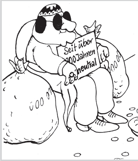
Bild 1: Illustration aus der Zeitschrift »Solidarität« (Nr. 40, Jg. 5, Okt. 1979, S. 6).

Innerhalb weniger Jahre entstand in der Schweiz rund um die Entwicklungsproblematik eine Vielzahl von Positionen, die sich grob in drei Gruppen gliedern lassen: Rechts standen die Entwicklungsskeptiker, die Steuergelder nur im Inland zum Ausgleich ökonomischer Differenzen verwenden wollten. Links standen die »Entwicklungsextremisten«, wie sie im Nationalrat einmal genannt wurden, 34 die das Wohlstandswachstum der Schweiz selbst für eine wesentliche Ursache des Elends in der Dritten Welt hielten und deshalb unter anderem auch Maßnahmen forderten, die direkt die Gewinnerwartungen von Schweizer Unternehmen bedrohten. Dazwischen fand sich eine »illusionslose« Gruppe, die aus moralischen Gründen und wegen des internationalen Ansehens der Schweiz in der Entwicklungszusammenarbeit eine notwendige Staatsaufgabe sah. Alle diese Positionen wurden wesentlich mit numerischen Argumenten untermauert.